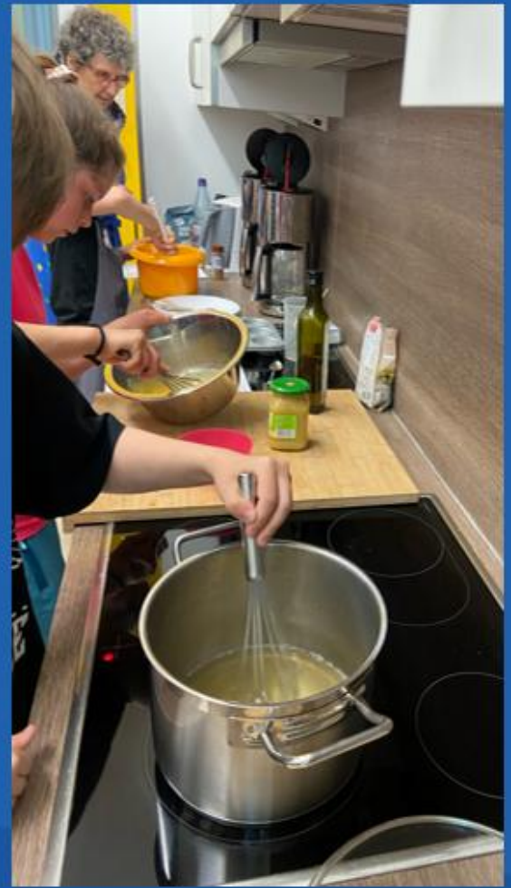
...gegen Rechts, mit den Omas