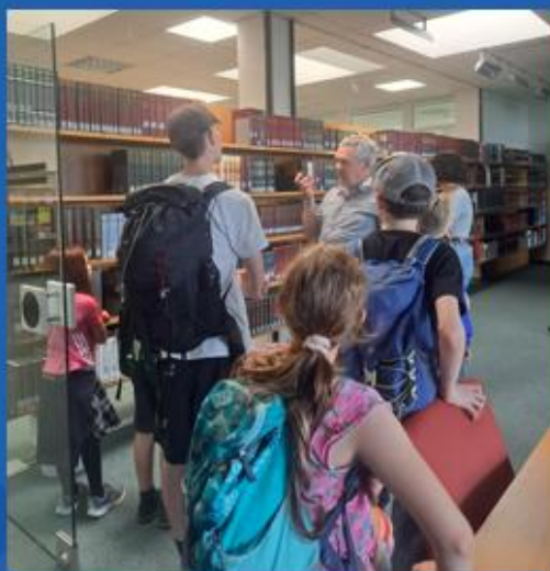
... das Herder Institut