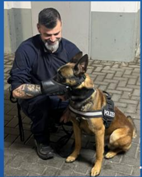
... die Polizei