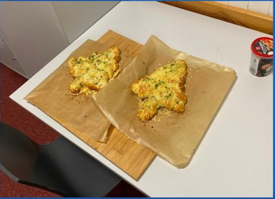
...winterliches aus dem Ofen