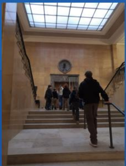
... das Staatsarchiv