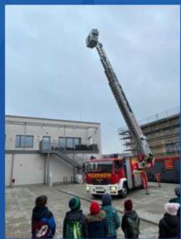
... die Feuerwehr