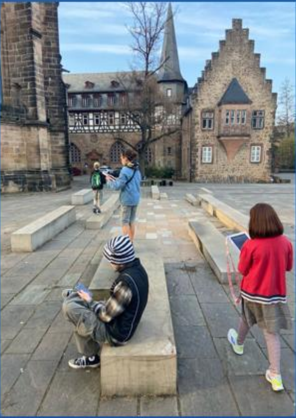
... Marburger Persönlichkeiten