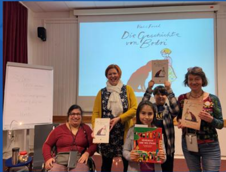
...im Haus der Jugend