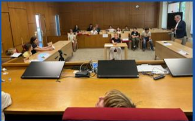
... das Amtsgericht