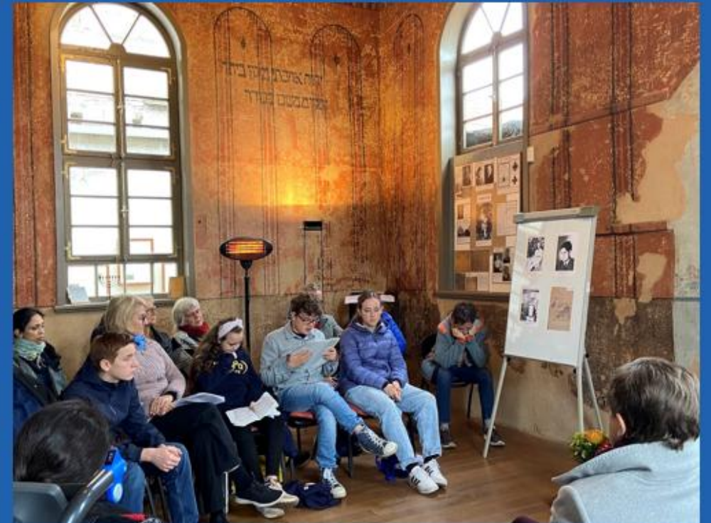
...in der Landessynagoge Roth