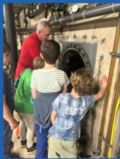
... das Aquamar