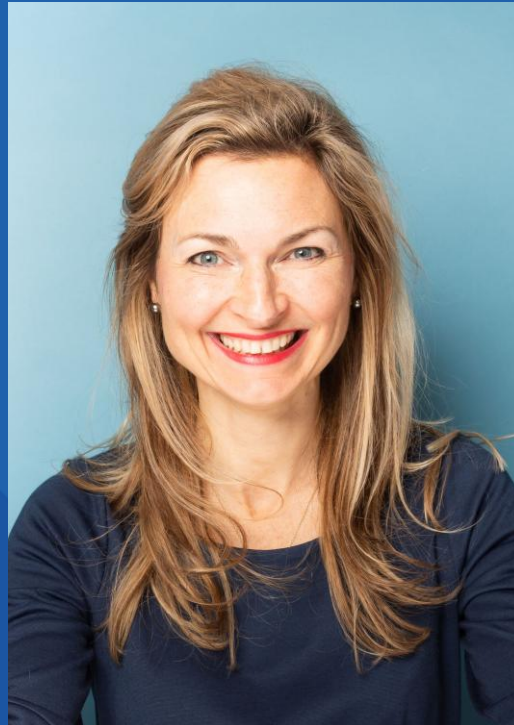
Bürgermeisterin und Jugenddezernentin Nadine Bernshausen