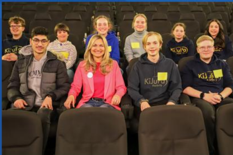
Neuer Vorstand des 14. KiJuPas