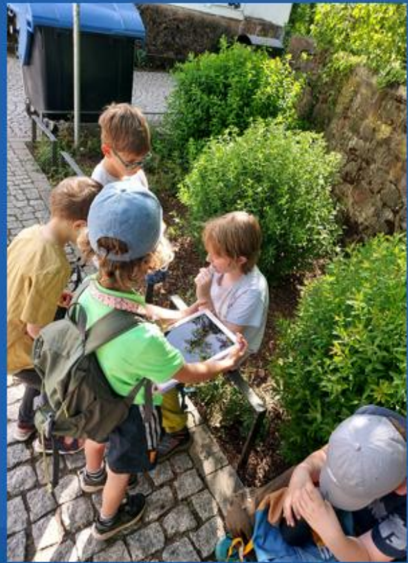
... der Planetenlehrpfad