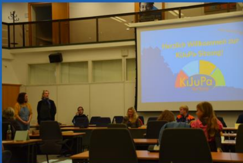
Und es folgten viele weitere Sitzungen!