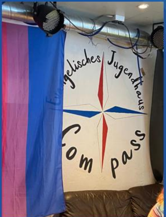
...evangelisches Jugendhaus Compass