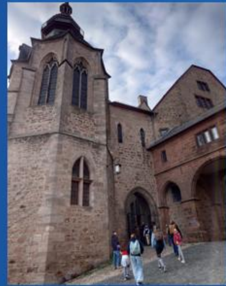
... das Schloss