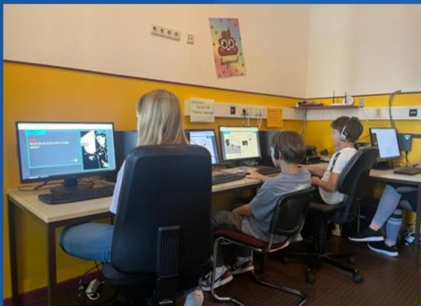
Zocken für die Demokratie