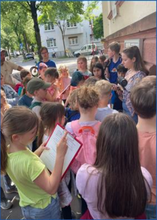
... Hexen in Marburg