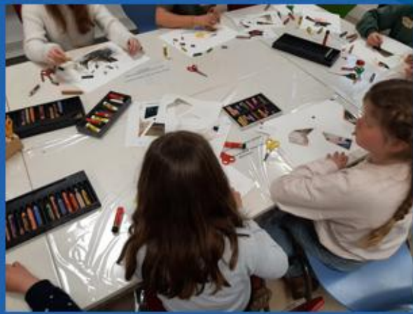
... das Kunstmuseum